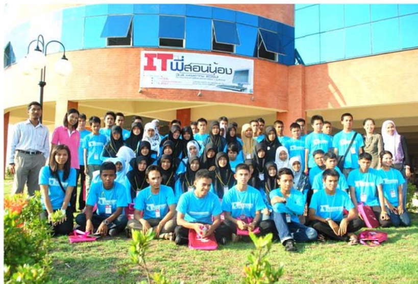
รูป : 7 วิทยากรและผู้เข้าอบรม