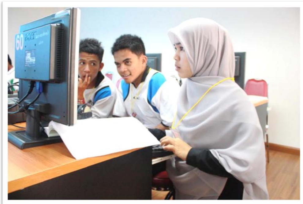
รูป : 4 บรรยายากศที่สอนน้องในกิจกรรม “ลองทำดู หนูทำได้”