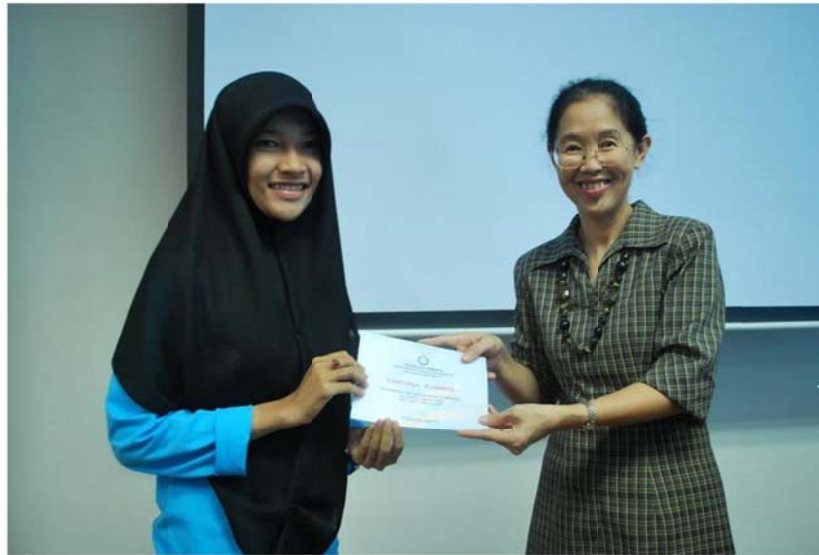
รูป : 5 คณะมอบวุฒิบัตรให้แก่ผู้เข้าอบรม