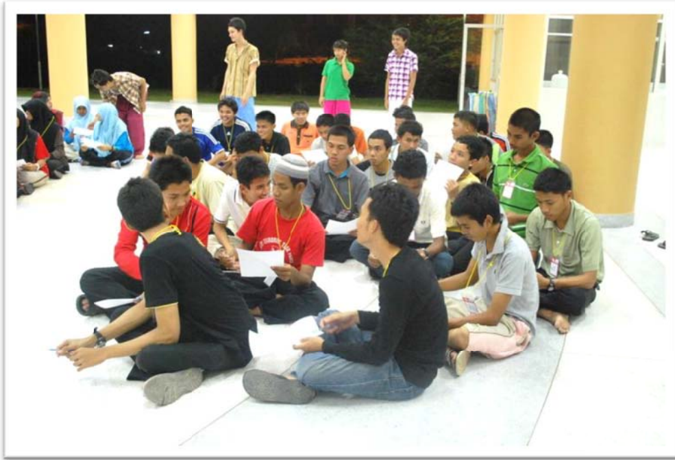
รูป : 3 กิจกรรมสถานสัมพันธ์ฉันและเธอ