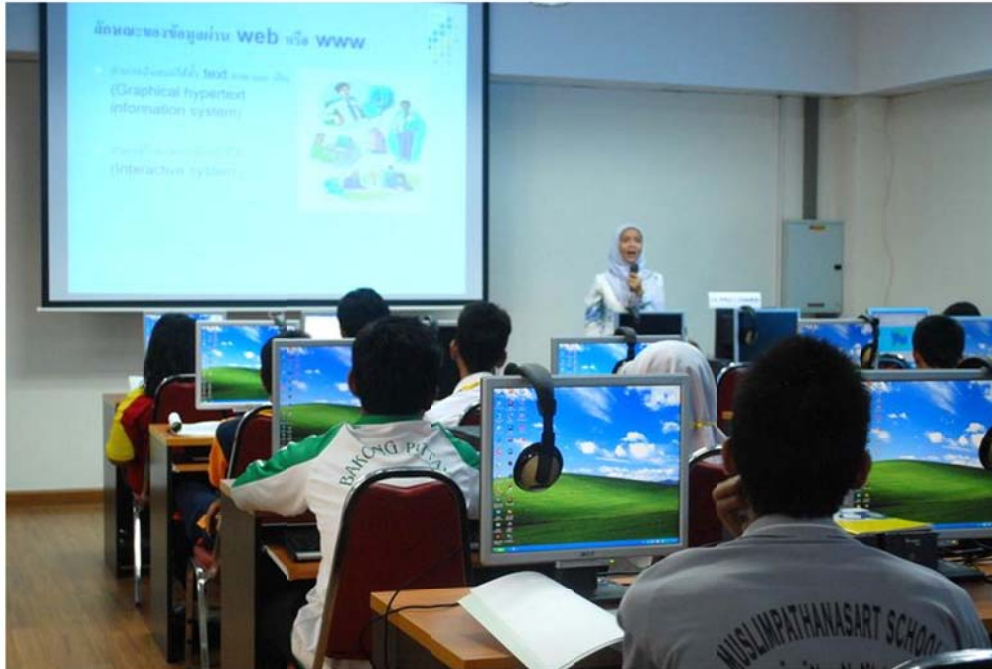
รูป : 1 บรรยากาศการอบรม

3-4 พฤษภาคม 2553 ณ คณะวิทยาการสื่อสาร มหาวิทยาลัยสงขลานครินทร์