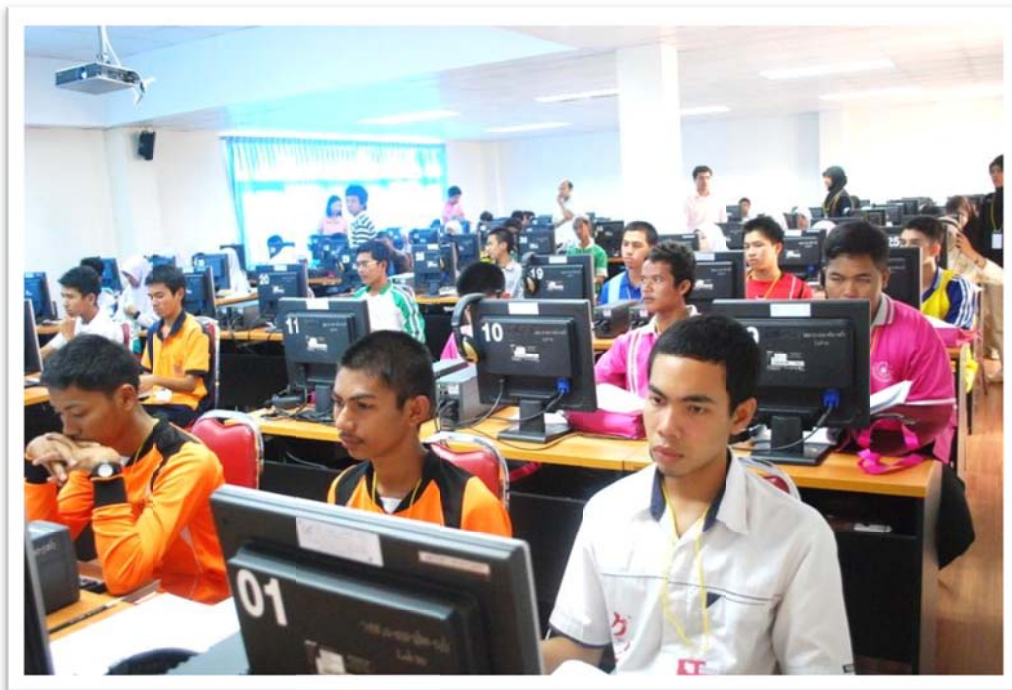
รูป : 2 ฝึกทักษะออกแบบเว็บไซต์